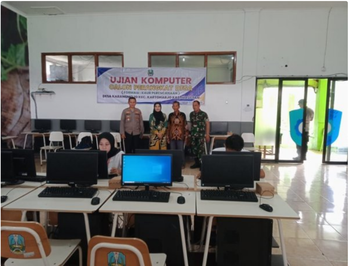
Danramil 0804/08 Barat Hadiri Penjaringan Ujian Praktek Komputer Calon Perangkat Desa Karangmojo

Magetan. – Komandan Koramil (Danramil) Tipe B 0804/08 Barat Kapten Inf