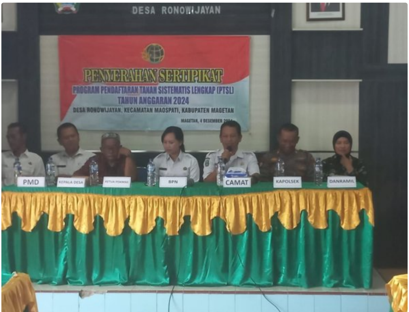
Danramil 0804/06 Maospati Hadiri Penyerahan Sertifikat PTSL Desa Ronowijayan

Magetan. - Bertempat di Balai Desa Ronowijayan, Kecamatan maospati,